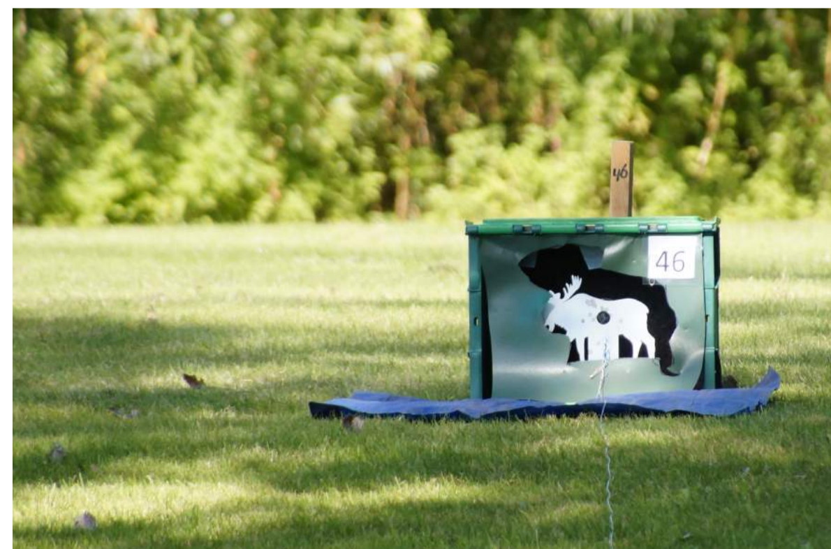
De klapdoeltjes hebben een zwarte doelschijf met een diameter van 15 tot 35 millimeter, afhankelijk van de afstand van het doeltje.